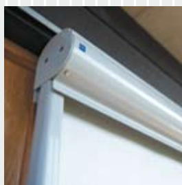
Kassett i strängpressat aluminium